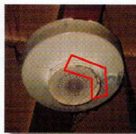
ほこりの溜まった住警器

住警器にホコリなどの汚れが付くと火災を感知しにくくなります。汚れは乾いた布で定期的にふき取りましょう。台所に設置してある住警器で油污れがひどいものは、家庭用中性洗剤を浸して十分絞った布で軽くふき取ってください。