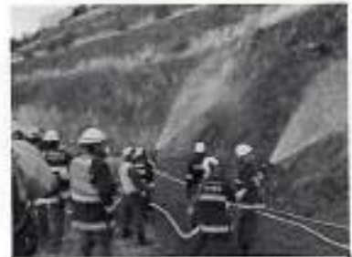
山林火災を想定した訓練

そこで密かに活躍しているのが・・・消防団！実はこの時期、彼らは地道に山へ入り、火の気がないか、不審な煙が立っていないかをチェックしています。火災の“タネ”を見つけては事前に処理。地味だけど超重要なこの任務、まるで「山の静かなるヒーロー」です。何も起きない日々の裏側には、こうした人たちの努力があるのです。「春の山が美しい」のは、誰かがしっかりと見守っているから。山に感謝、そして見えないヒーローたちにも拍手を！