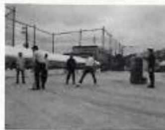
バケツリレー消火訓練

地震や火災などの災害を想定し、避難・救助・情報伝達など一連の対応を実施する訓練です。全体の流れを理解しやすい反面、準備に時間がかかるため、他の訓練で基礎を固めた後に行うと効果的です。