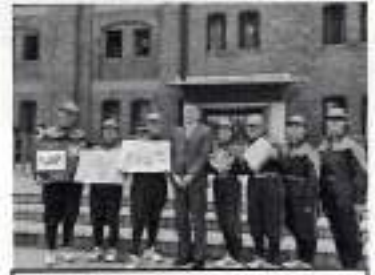
女性隊メンバーと初宿市長

大会に向けては、夏の暑さが残る9月から週3回の訓練を重ねました。平日は仕事終わりの夜間、市役所の駐車場などで消防車の照明を頼りに練習を行いました。市内12個部の消防分団が輪番でサポートに入り、全消防団を挙げて女性隊をバックアップしました。