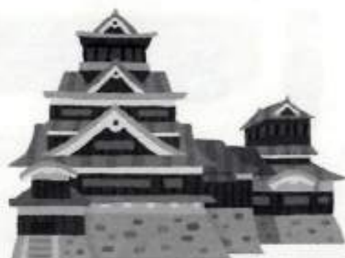
実は熊本城、西南戦争であの西郷どんが攻めたものの、落城しなかった難攻不落の名城です

このように、昔の人たちは、限られた材料と知恵で、「災害に備える」工夫を重ねていたのです。それは、現代の私たちにも通じる大切な考え方ではないでしょうか。今回は、そんなお城とともに災害への備えを学んでみましょう。