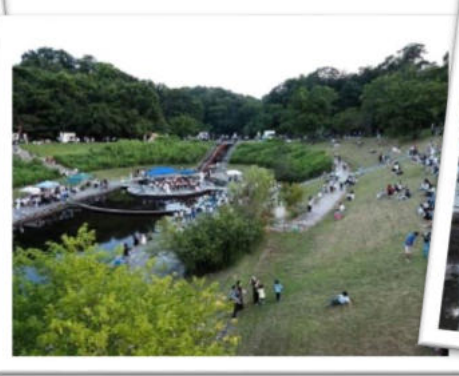
漸く、日が陰りました