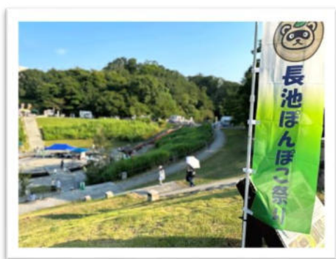
ぽんぽこ祭り、暑い！

また、おやじの会（エヌ・シティ東自治会）による射的など子どもたちが楽しめるゲームの出店は、参加者が200名をはるかに超えるなどの盛況ぶりでした。今後も地域の絆を深めるお祭りとして、可能な範囲で協力をしてまいります。