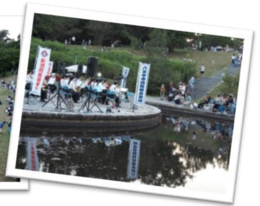
八王子市消防団音楽隊の演奏