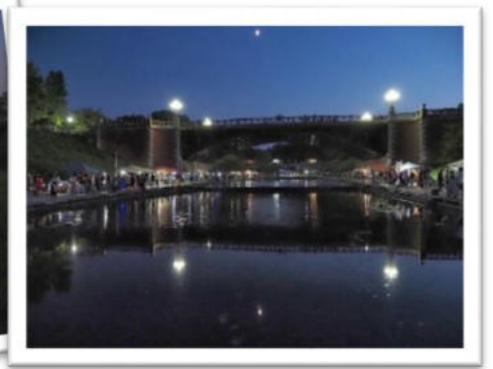
上弦の月が上空に