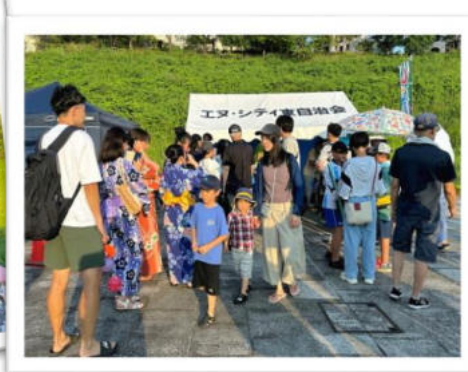
「エヌ・シティ東」は射的