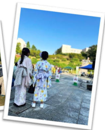
夏祭りという感じ