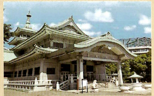
東京都慰霊堂（横網町公園内）

日 時： 令和6年11月6日（水） 7時45分～16時30分解散予定 集合解散： 八王子消防署（八王子市上野町33） 視察場所： 東京都立横網町公園 （東京都墨田区横網二丁目3番25号）